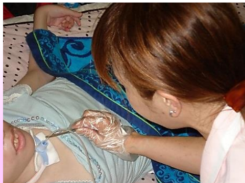
ヘルパーによる喀痰吸引