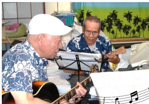
ウクレレとギターでセッション