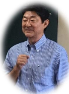
大澤町会長も ご参加下さいました