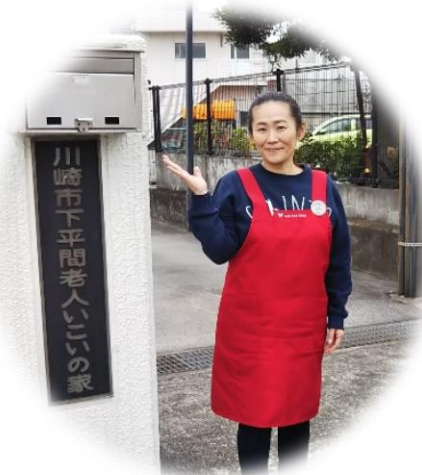
管理人さんが迎えてくれます